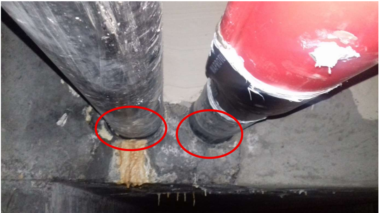
Szczelina przy dolnej krawędzi dewiatora (osłona dociśnięta do górnej krawędzi dewiatora).